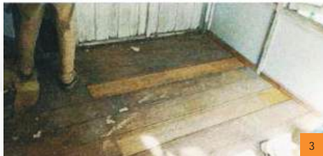
Gambarajah : Sebelum Pembaikan (1), Semasa Pembaikan (2) & Selepas Pembaikan (3)