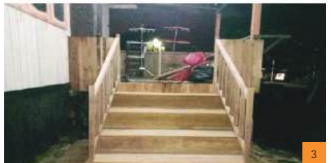
Gambarajah : Sebelum Pembaikan (1), Semasa Pembaikan (2) & Selepas Pembaikan (3)